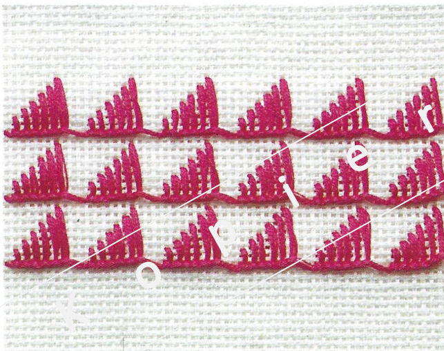
Festonstichreihen mit unterschiedlichen Stichhöhen